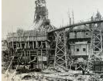
La centrale n'existe pas encore. Voici les premiers échafaudages.

Mais La Gabelle, c'est beaucoup plus que ça. C'est avant tout une centrale hydroélectrique. Mais au-delà de ces considérations purement techniques, c'est un bâtiment à grande valeur architecturale. C'est aussi un site qui, dans l'imaginaire populaire, représente Notre-Dame-du-Mont-Carmel. Les deux entités sont étroitement associées.