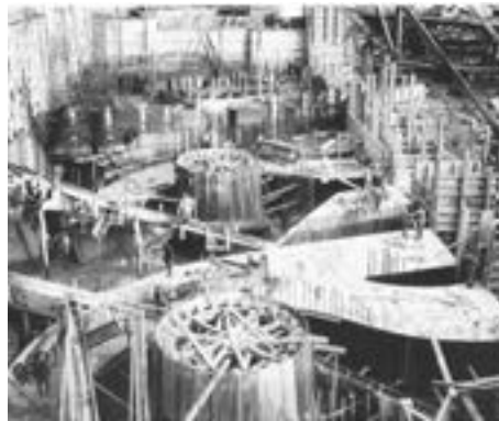
Construction de la centrale La Gabelle en 1923.

La mise en chantier débute en 1922 et l'inauguration a lieu deux ans plus tard, au printemps 1924.