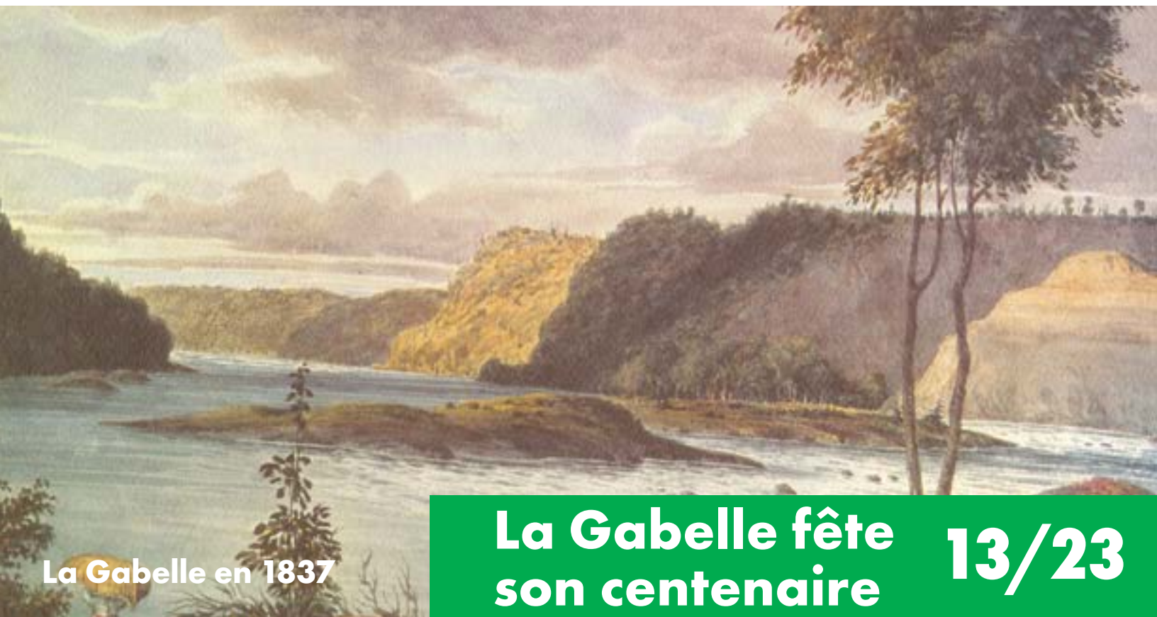
La Gabelle en 1837