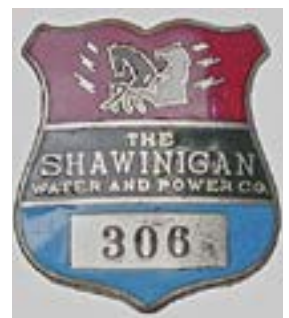
Insigne en métal porté par les employés de la Shawinigan Water and Power Company dans les années 1950.

Restez à l'affût pour connaître la date exacte de cette activité. À l'automne 2024, vous serez conviés à passer nous raconter vos plus belles anecdotes. Nous serons tout yeux, tout oreilles !