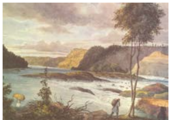
Peinture réalisée par Philip John Bainbridge en 1837 représentant le site de La Gabelle avant la construction du barrage.

Il n'a pas toujours été possible de passer sur le barrage. Ce n'est qu'à la suite de cette réfection majeure que les véhicules, vélos, piétons et véhicules récréatifs ont pu emprunter le lien interrives.