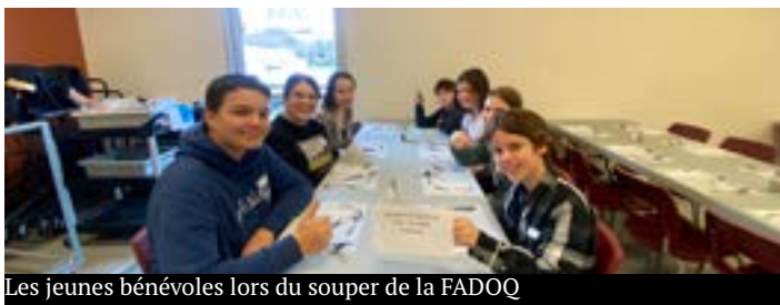
Les jeunes bénévoles lors du souper de la FADOQ

Nous tenons également à remercier la FADOQ de Notre-Dame-du-Mont-Carmel . Lors d'un de leur dî-